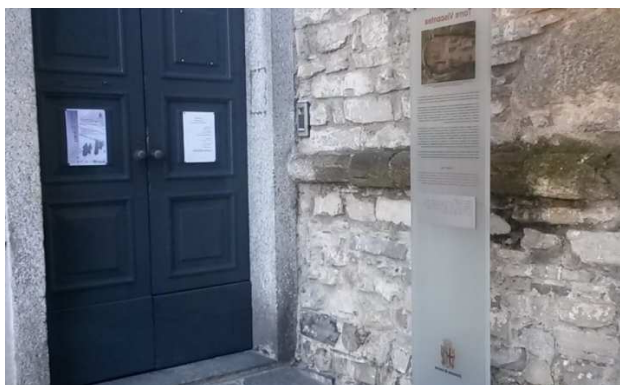
FOTO TOTEM TORRE VISCONTEA

Il Totem che è nostra intenzione installare sarebbe eseguito nello stesso materiale e fattura di quelli già esistenti nella città di Lecco (esempio totem Torre Viscontea) con una raffigurazione storica della città ed una breve descrizione riportante i cenni storici del Vicolo Granai e vicolo del Torchio