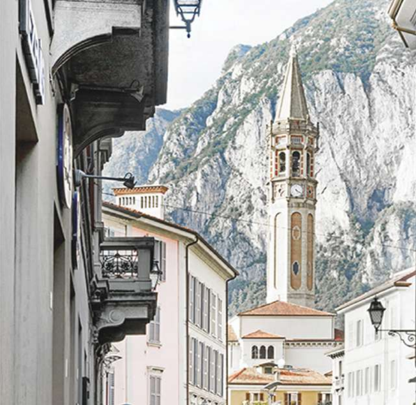
Ti parlo di Lecco