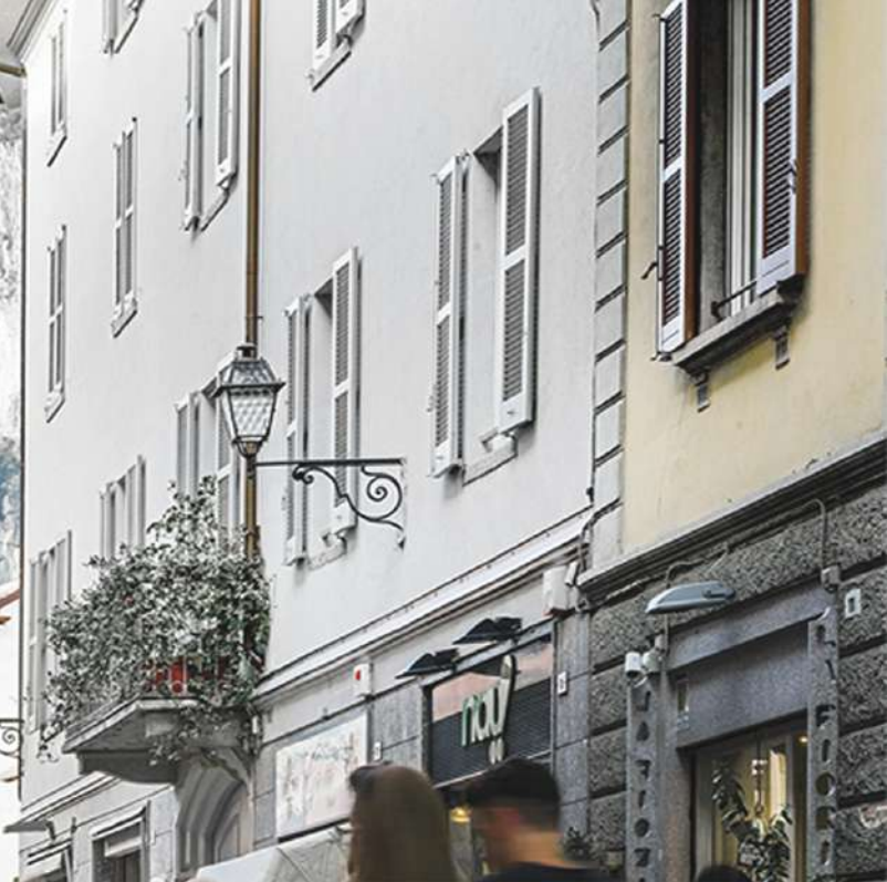
Palazzo delle Paure