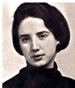
Franca Viola, la prima donna italiana a rifiutare il matrimonio riparatore.