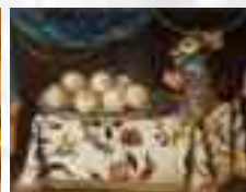
Gianlisi Antonio secc. XVII/XVIII