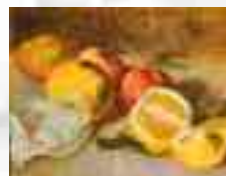
Ambito lombardo sec. XX