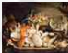
Ambito lombardo fine sec. XVII