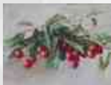
Ambito lombardo secc. XIX/XX